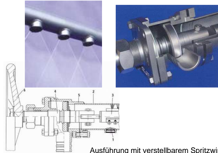
Ausführung mit verstellbarem Spritzwinkel